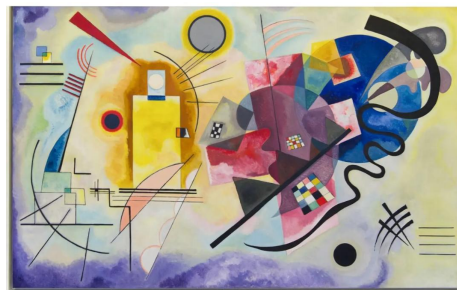
| Amarillo, rojo y azul, de Vasili Kandinski (1925)