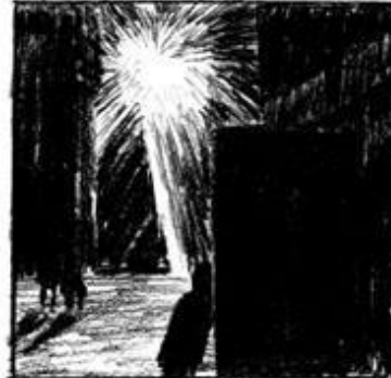
BAJA: dramática, solemne, profunda, misterio

Actividad: Realizar 3 dibujos con cada escala correspondiente