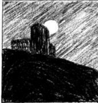
INTERMEDIA: equilibrada, sobria