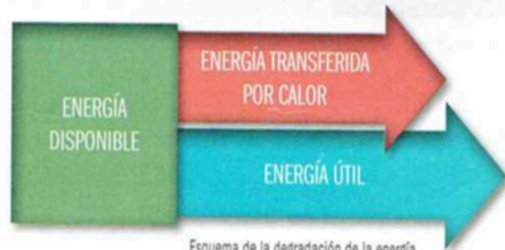
Esquema de la degradación de la energía como calor durante una transformación.

Los seres vivos transferimos energía por calor al ambiente como resultado de transformar la energía química de los alimentos en la energía que necesitamos para realizar las funciones vitales, como la cinética, que mantiene, por ejemplo, los latidos del corazón; pero parte de esa energía química se disipa por calor.