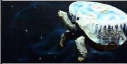
Figura simple – Fondo complejo