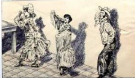
Figura y fondo ambivalente